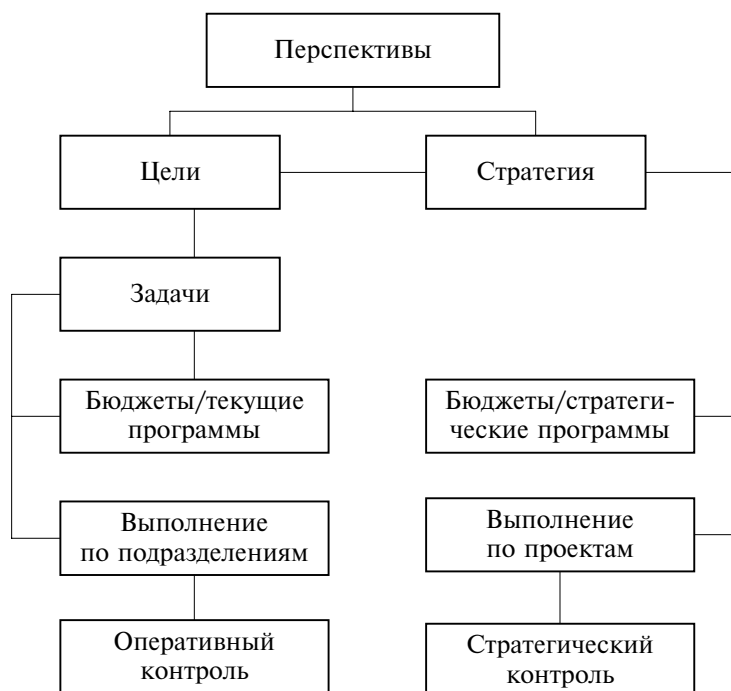
Рис. 10.1. Схема стратегического планирования