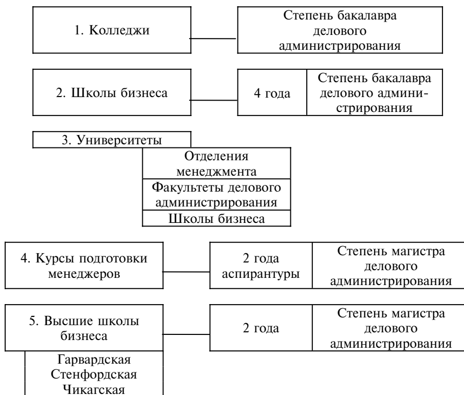
Рис. 23.1. Система подготовки кадров менеджеров в США

В основе японской системы профессионального обучения в фирмах лежит концепция «гибкого работника». Ее цель — отбор и подготовка работника не по одной, а по крайней мере по двум-трем специальностям, а затем повышение квалификации на протяжении всей жизни.