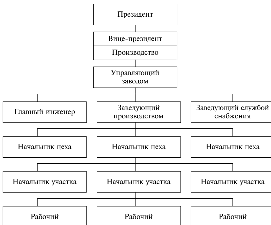
Рис. 21.1. Структура управления производством в американских фирмах

Производственная структура концерна характеризует состав фирм (предприятий), входящих в концерн: по мощности, характеру и формам специализации и кооперирования, признакам производимой продукции.