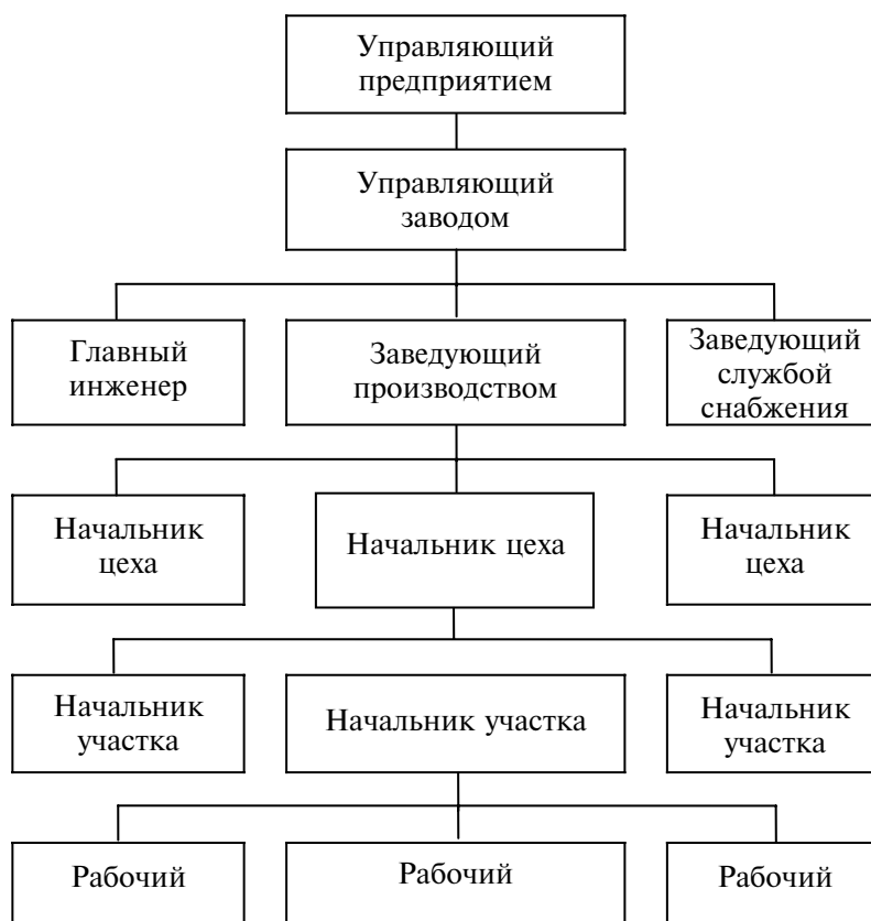
Рис. 15.1. Схема производственной структуры предприятия

пасных частей для обслуживания выпускаемых изделий и их ремонта в процессе эксплуатации. Сюда относятся также подразделения по выработке энергии для технологических целей.